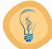
برنامج هدكا للتوعية HDCA Education