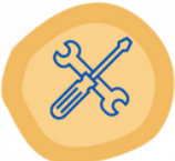
الورشة المتنقة لصيانة الأجهزة التنموية للأفراد ذوي الإعاقة workshop for the maintenance of prosthetic devices for people with disabilities