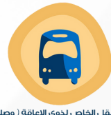
برنامج النقل الخاص لذوي الإعاقة (وصلني) HDCA Transportation Program for Individuals with Disabilities