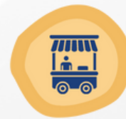
مشروع عربات متحركة (FOOD TRUCK) لتغذية دخل أفراد ذوي الإعاقة