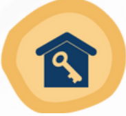
مشروع تملك الإسكان التنموي للأفراد لذوي الإعاقة