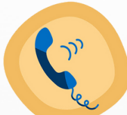
الهاتف الاستشاري المجاني (أرشدي) HDCA Consulting Telephone Program