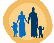
برنامج هدكا الاجتماعي HDCA Social Program