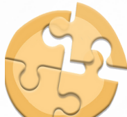
مركز حائل للتوحد Haiti Autism Center