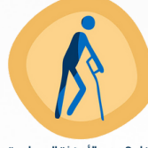
برنامج دعم الأجهزة المساعدة HDCA Assistive Devices Support Program